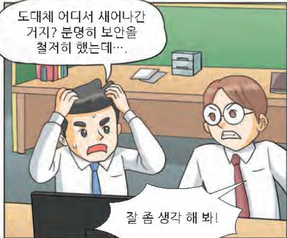
1 만화로 보는 알기쉬운 해킹메일 대처법